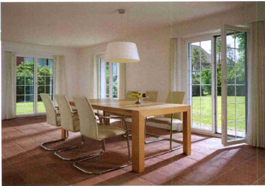
Beispiel eines sanierten Wohnobjekts.

Themen-Nr.: 689.21 Abo-Nr.: 1087379 Seite: 82 Fläche: 61'385 mm 2